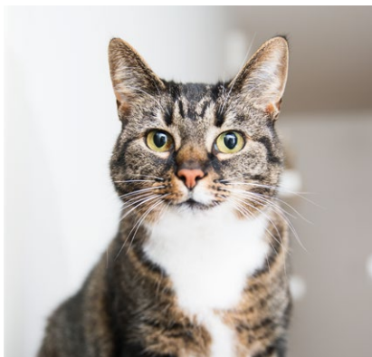
Dolly-kissakin viihtyy Laitilassa.

Riitta Perkkolan mukana Laitilaan muutti myös hänelle rakas perintölipasto. Se kokoaa yhteen tärkeimpiä valokuvia ja esineitä.